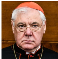
Kardinal Gerhard Ludwig Müller